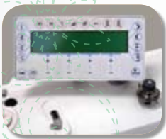
Painel de fácil operação: permite programar diretamente pontos decorativos