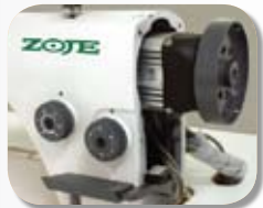
Sistema Direct Drive: maior desempenho com redução de ruído

AGILIDADE Máquina equipada com motor de passo no movimento da barra da agulha e mecanismos rolamentados que diminuem o atrito do eixo, o que permite o aumento da velocidade sem causar o aquecimento dos mecanismos. Seu sistema de retrocesso automático viabiliza a criação de pontos decorativos mais complexos e exclusivos.