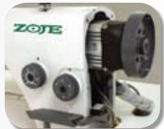
Sistema Direct Drive: maior desempenho com redução de ruído

AGILIDADE Máquina equipada com motor de passo no movimento da barra da agulha e mecanismos rolamentados que diminuem o atrito do eixo, o que permite o aumento da velocidade sem causar o aquecimento dos mecanismos. Seu sistema de retrocesso automático viabiliza a criação de pontos decorativos mais complexos e exclusivos.